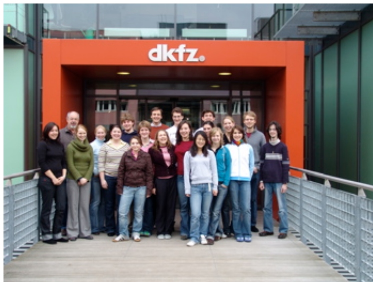
Die deutschen Teilnehmer der ISA Estland.

Mit der ISA-Estland stellt sich das Life-Science Lab einer neuen Herausforderung: Nach den sehr erfolgreichen ISAs in Portugal und San Francisco entstand die Idee, das Konzept der ISA um die Komponente der Gegenseitigkeit zu erweitern, um so den interkulturellen Charakter noch weiter zu stärken. Daher ist die ISA Estland als Austauschprogramm konzipiert. Im Rahmen des Projekts sollen 15 deutsche und 15 estnische Jugendliche im Alter zwischen 16 und 18 Jahren selbst Einblick in die aktuelle Forschung und die estnische Kultur bekommen. Gemeinsam möchten wir im internationalen Kontext wissenschaftliche Fragestellungen und deren ethischen und gesellschaftlichen Implikationen diskutieren.