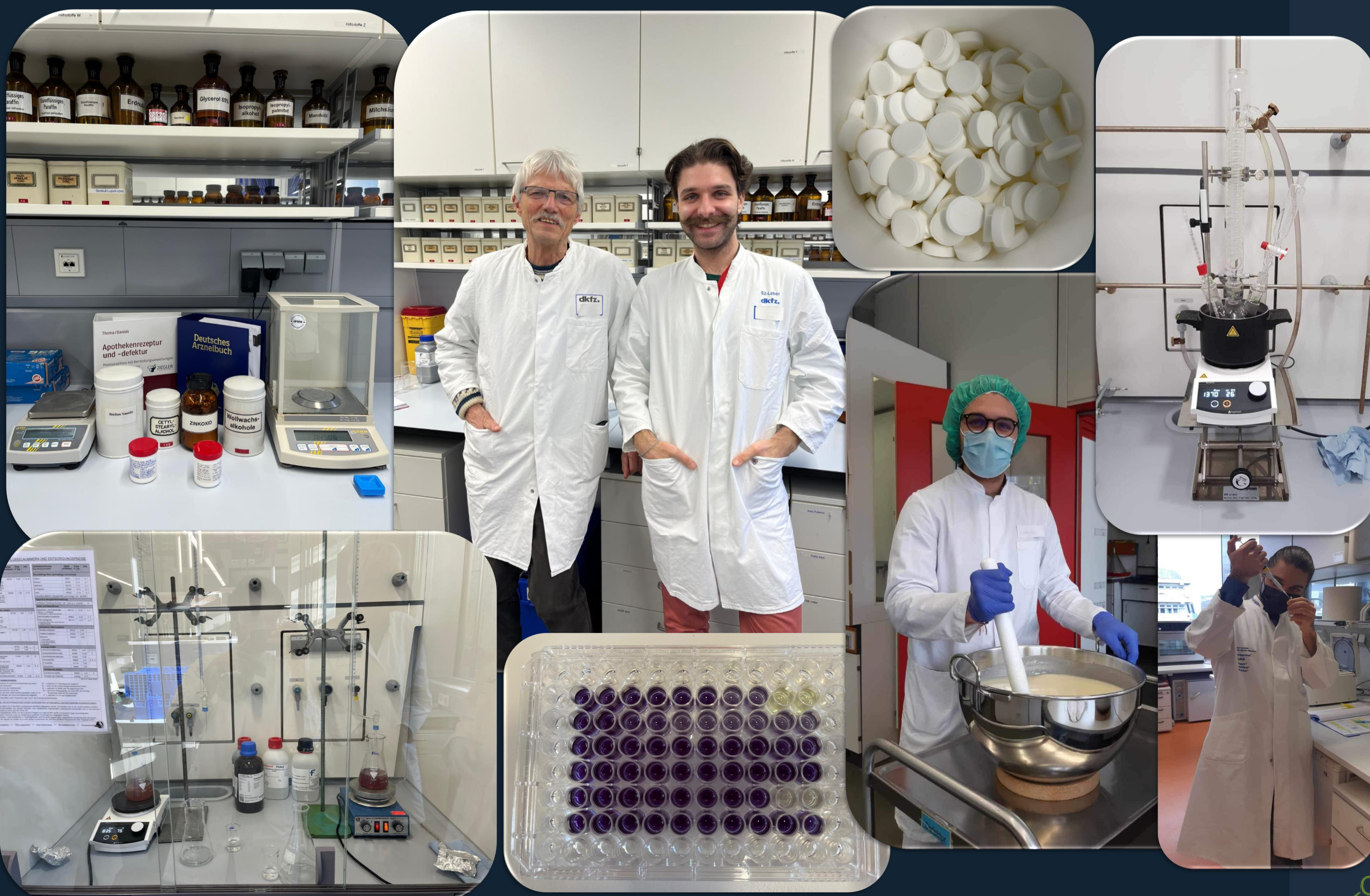
Einige Momente aus den pharmazeutischen Laboren ...

Alle NaWi Disziplinen sind bei uns willkommen!